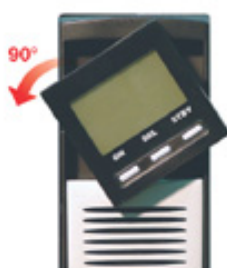
2. Повернуть панель управления и вновь вставить ее в гнездо