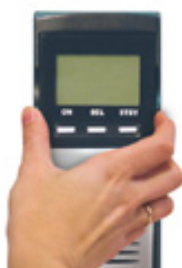
1. Извлечь панель управления